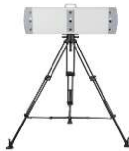
撮影機材 (カメラ部分)