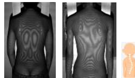
撮影画像 (旧機材のもの)