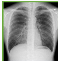
通常の胸部X線画像

胸部X線撮影時に3枚の画像を生成 高度な画像処理技術により 診断能の高い画像を取得