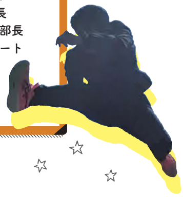
▼株式会社愛亀さまにて(2021年)